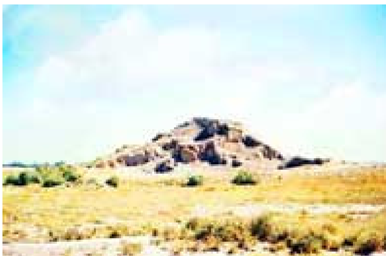
داش تپه - میاندوآب

داش تپه به اعتبار آثار قلعه مانندی که روزگاری بر فراز آن بوده و دهانه آن با وسایل و مصالح لازم و با نهایت مهارت مسدود شده است در کنار روستای داش تپه در حوالی میاندوآب قرار دارد . در سمت شرقی تپه محل یک درب ورودی به درون تپه دیده می شود که از ساروج و آهک ساخته شده است ، اهالی محل اقدامات زیادی برای ورود به تپه (درون قلعه) انجام داده اند که تاکنون بی نتیجه مانده است. بین اهالی شهر مشهور است که قبر زرتشت پیامبر پاک آیین ایرانی درون این تپه قرار دارد . این تپه هنوز جزء آثار باستانی به ثبت نرسیده است.