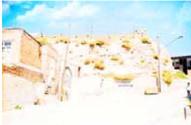
قلعه بختک - میاندوآب

قلعه بختک که بقایای خرابه های آن هنوز هم در روستای میلان (یکی از روستاهای میاندوآب) قرار دارد . گویا توسط یکی از سرداران خسرو انوشیروان به نام بحدک ساخته شده است . ظاهراً علت احداث قلعه آزمودن قدرت نظامی و نشان دادن آن به شاهنشاه ساسانی بوده که توسط بحدک پیشنهاد شده است . بنای قلعه بسیار محکم ساخته شده است . طبق آثار موجود ، آب مورد نیاز قلعه را از چها فرسنگی طوری به قلعه هدایت می کرده اند که غیر از بختک و تنی از چند از مقربین او کسی از سرچشمه آب اطلاعی نداشته است.