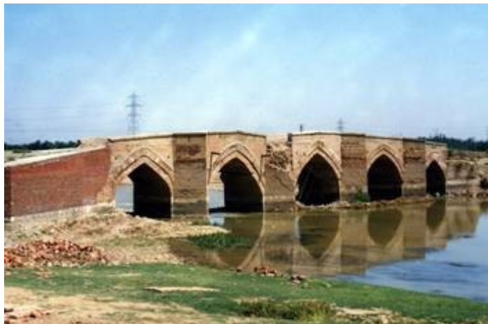
پل میرزا رسول - میاندوآب

این بنا در قسمت پایه ها و سیل شکن ها ، سنگ و در بقیه قسمتها آجر می باشد . این بنا به شماره ۲۰۶۸ در فهرست آثار ملی ثبت شده است.