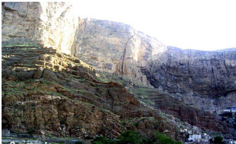
نمایی از کوههای اطراف شهرستان ماکو

حکومت ماکو در دوره زندیه و قاجاریه در دست ایل بیات بود. ایل بیات تیره ای از ایل قره قویونلو بود که مسکن اصلی آنان شرق آناتولی بود و در رکاب قره قویونلوها وارد ایران شدند.