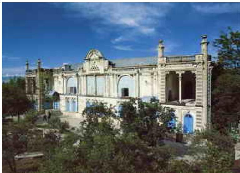
« نماهایی از کاخ باغچه جوق »

در شش کیلومتری ماکو در روستائی به همین نام واقع است که ساختمان آن در زمان تیمور پاشاخان شروع و در زمان حکومت فرزندش مرتضی قلی خان اقبال السلطنه ( سردار ماکو ) به اتمام رسیده و محل سکونت بیلاقی آن بود ( جوق در زبان ارمنی یعنی ده ) در ساختمان کاخ معماران ایرانی و مهندسان روسی و اروپایی به اتفاق کار کرده اند و هیئت کاخ تلفیقی از معماری شرق و غرب است . گچ بری ساختمان توسط اساتید ایرانی انجام پذیرفته . آئینه کاری و گچ بری ساختمان در سطح عالی است در بالای عمارت دور تا دور گلدانها و مجسمه ها وجود دارد که اغلب جای گل و چراغ است .