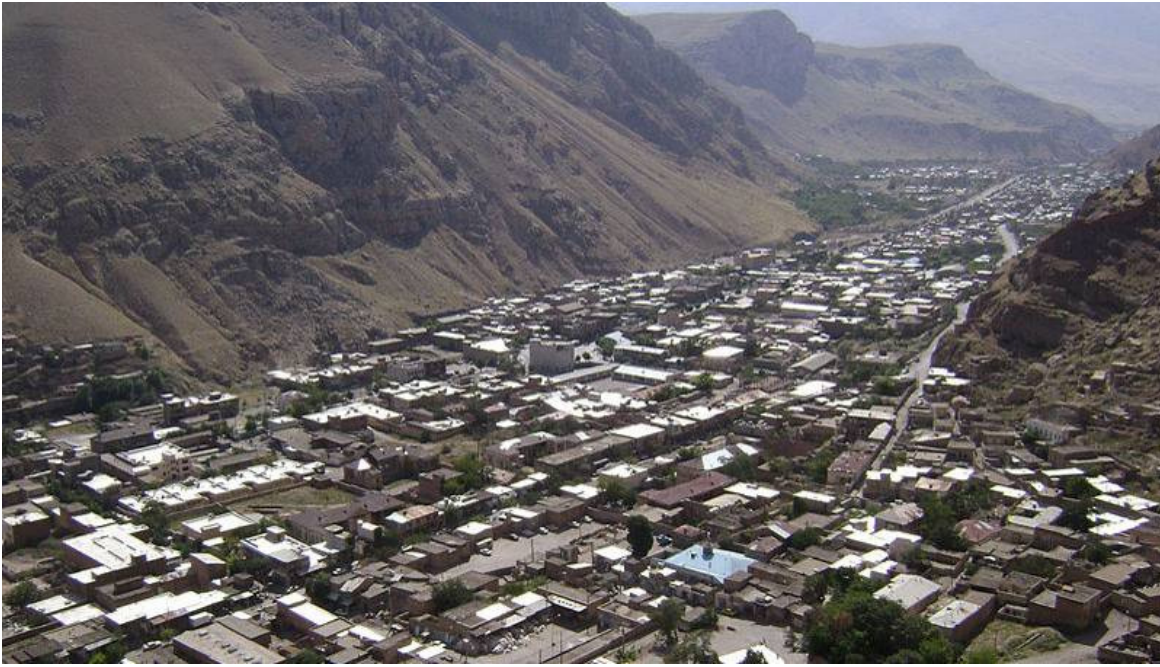
نمایی از شهر ماکو