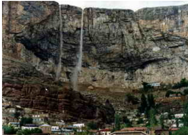
نمایی از کوه قیه ماکو بعد از بارندگی

شهرستان ماکو در گوشه شمال غربی ایران (استان آذربایجان غربی) قرار گرفته که از شمال به رودخانه قره سو و کشور ترکیه، از شرق به رودخانه ارس و جمهوری آذربایجان و از مغرب به جمهوری ترکیه و از جنوب به شهرستان خوی محدود است.